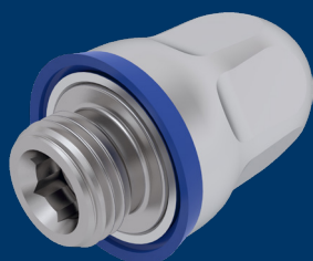
3028 | Raccord hygiénique droit à visser